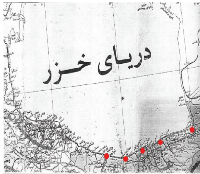
شکل ۱. نقشه ی ایستگاه های نمونه برداری

مربوط به ترکیب مورد نظر (ددت) در کروماتوگرام با سطح زیر منحنی سم استاندارد (کروماتوگرام محلول استاندارد) غلظت سم محاسبه گشت. (۱۰)