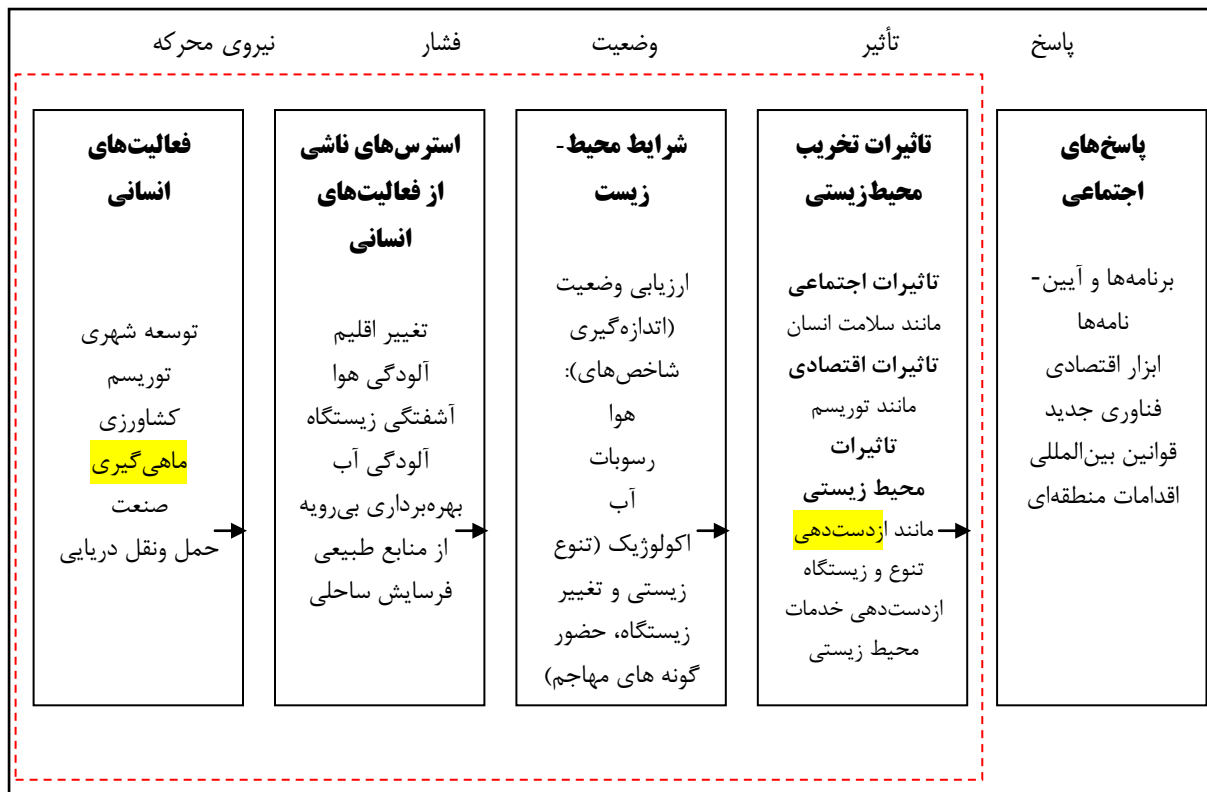
شکل ۱- مثال‌هایی از مسائلی مطرح‌شده در عناصر چارچوب DPSIR (۱۹)